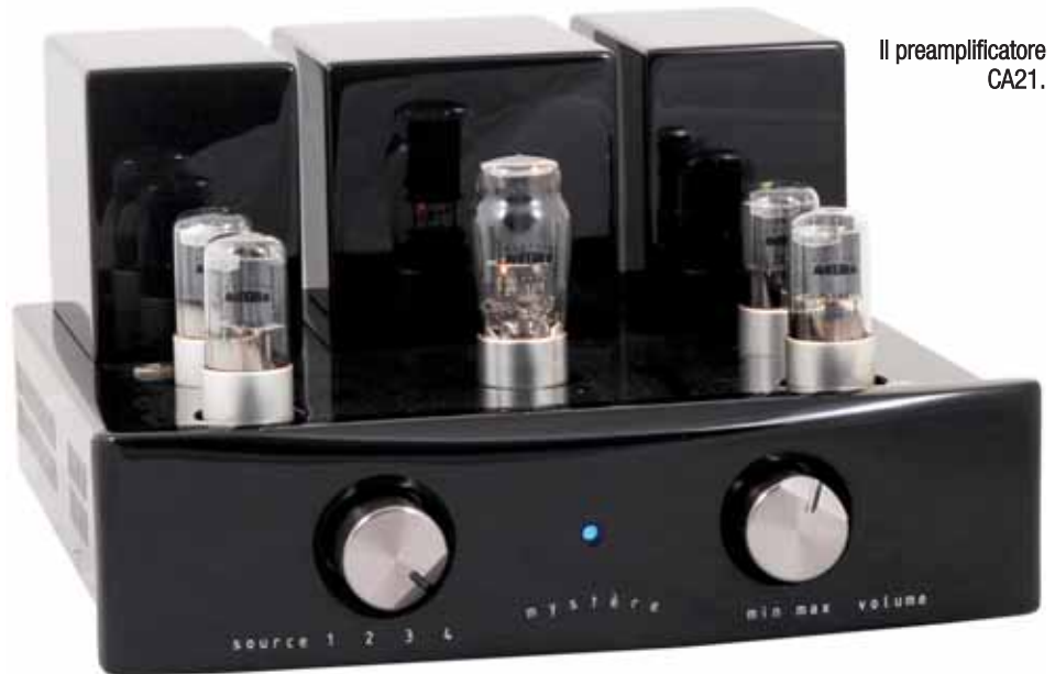
Il preamplificatore CA21.

Il preamplificatore dispone di quattro ingressi, ma manca l'uscita rec out. Il finale vede il contatto positivo sdoppiato, con l'opzione 4/8 Ohm. Ho stabilmente usato il primo, per avere un'erogazione più certa con i piccoli diffusori usati, che spesso, al di là di quanto immaginabile, hanno un modulo dell'impedenza molto tormentato. Gli eleganti interruttori di accensione sono posti a lato degli apparecchi. Il finale ne presenta due, quello a sinistra deputato alla regolazione del bias, a due posizioni. Ho preferito quella contrassegnata II per il suono più morbido e musicale. Per quanto riguarda l'interno, occorre dire che la costruzione è estremamente ordinata, con una decisa propensione all'essenzialità, confermata anche dalla mancanza di circuiti stampati. I percorsi dei cavi hanno un gradevole aspetto, che rivela la curata manualità della realizzazione. ■